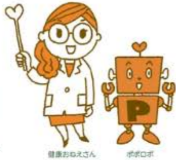
健康おねえさん ポポロボ

トヨタ健保では、みなさんの健康を守るためにいろいろな健診を行っています。 健康づくりの第一歩は、「自分の健康状態を知る」こと。 病気の早期発見・早期治療のためにも年に1度は健診を受け、自分のカラダをチェックしましょう!