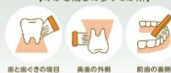
歯と歯ぐきの境目