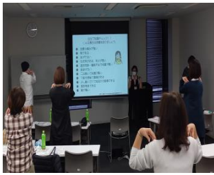
簡単な運動タイム