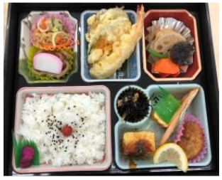
おいしいお弁当で ランチタイム♪